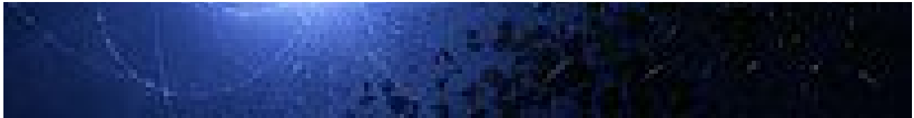
Trovata una stella cannibale, ha una cicatrice metallica VIDEO