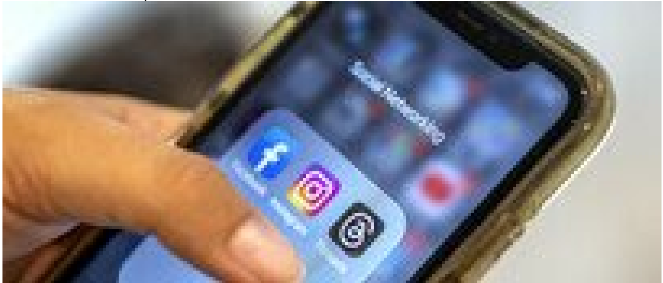
Instagram lavora alla mappa per vedere dove sono gli amici